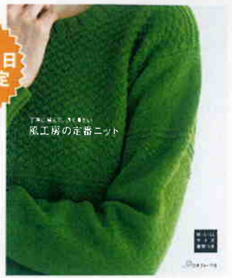
「風工房の定番ニット」 風工房 著 ¥1,500 (税別)